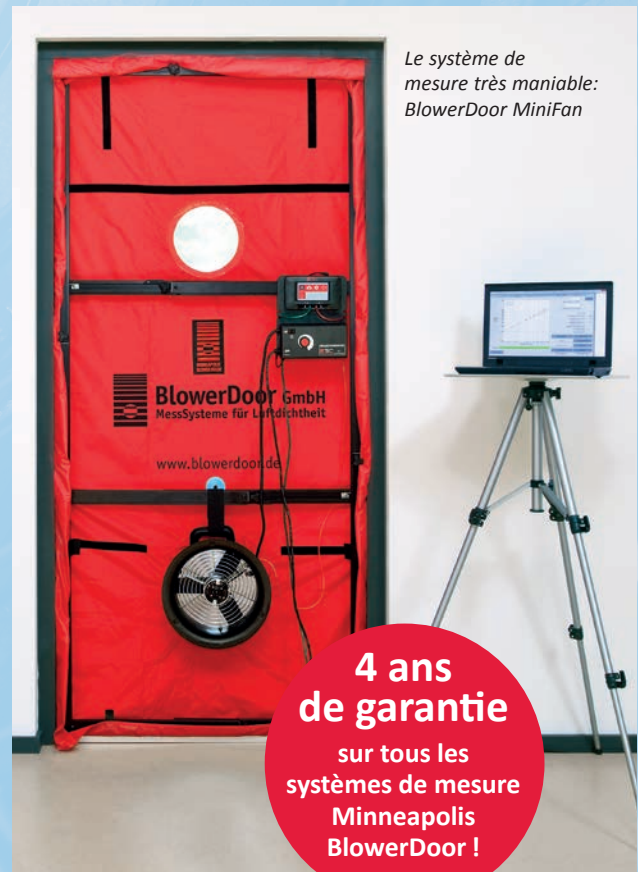
Le système de mesure très maniable: BlowerDoor MiniFan

Le pilotage du ventilateur pour les mesures en 1-point est effectué directement par le manomètre DG-1000 (fonction régulateur de vitesse), il n'est pas nécessaire d'utiliser un ordinateur. L'état de l'enveloppe du bâtiment est vérifié à l'aide d'une différence de pression au choix mais constante. Si des fuites sont détectées, celles-ci peuvent généralement être éliminées sans trop d'effort lorsque le bâtiment est en phase de construction. Les différents corps de métier peuvent ainsi rapidement attester et documenter la qualité de leur travail.